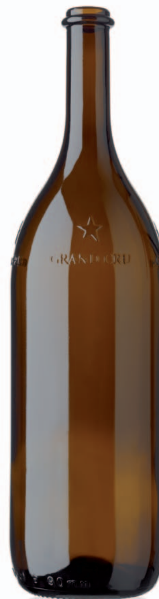
Grand Cru Valais 150cl

Fiches techniques sur www.univerre-prouva.ch