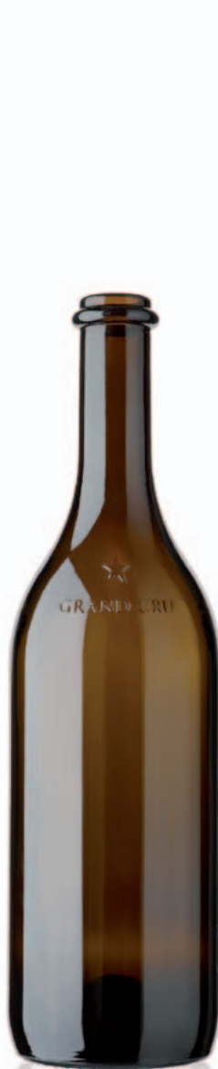
Grand Cru Valais 37.5cl