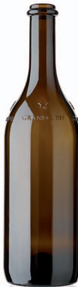
Grand Cru Valais 75cl